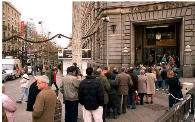
Colas en la sede del Banco de España en Barcelona para cambiar pesetas por euros, 2 de enero de 2002