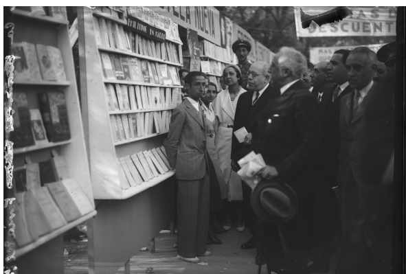
El presidente de la República Niceto Alcalá Zamora con el jefe del Gobierno Manuel Azaña, en la primera Feria del Libro de Madrid (abril 1933).