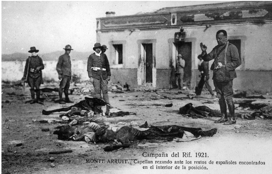
Campana del Rif. 1921. MONTE ARRUIT. Capellán rezando ante los restos de españoles encontrados en el interior de la posición.

Campana del Rif, posición de Monte Arruit: capellán rezando ante los restos de españoles encontrados en el interior de la posición