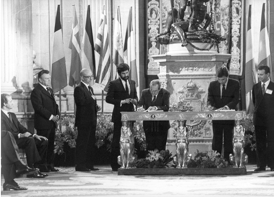
Firma del Tratado de Adhesión de España a la CEE. 12 de junio de 1985. Página web del Ministerio de Asuntos Exteriores y de Cooperación

FUENTE HISTÓRICA: Relacione esta imagen con la integración de España en Europa