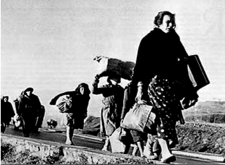
Fotografía de Robert Capa de un grupo de españoles camino del exilio a Francia.

FUENTE HISTÓRICA: Relacione esta fotografía con el exilio durante la dictadura franquista.